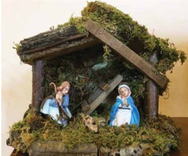
Presepe tipo A - € 35,00

Via San Gregorio Armeno è una strada del centro storico di Napoli celebre per le botteghe artigiane di presepi. La tradizione presepiale risale alla fine del XVIII secolo, ma ha un'origine remota: in epoca classica, esisteva, in quella strada, un tempio dedicato a Cerere, alla quale i cittadini offrivano, come ex voto, delle piccole statuine di terracotta fabbricate nelle botteghe vicine.