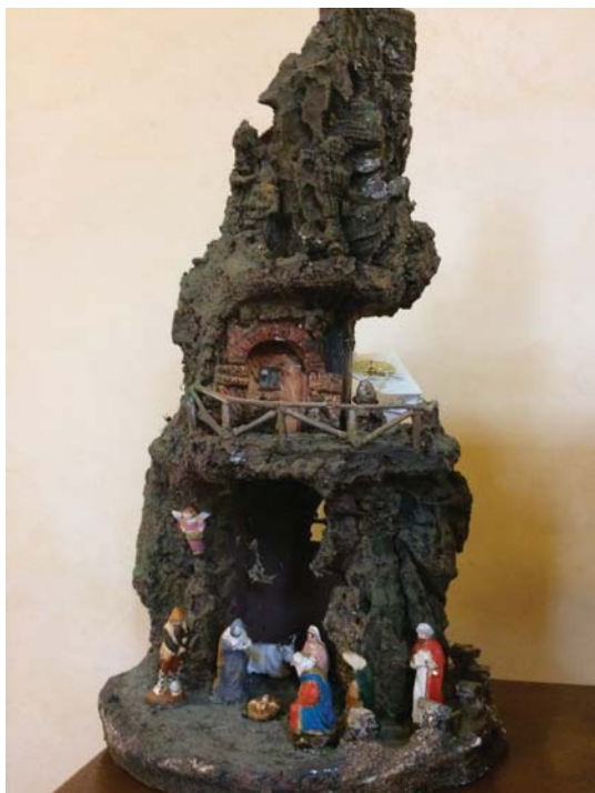
Presepe tipo B - € 100,00

Via San Gregorio Armeno è una strada del centro storico di Napoli celebre per le botteghe artigiane di presepi. La tradizione presepiale risale alla fine del XVIII secolo, ma ha un'origine remota: in epoca classica, esisteva, in quella strada, un tempio dedicato a Cerere, alla quale i cittadini offrivano, come ex voto, delle piccole statuine di terracotta fabbricate nelle botteghe vicine.