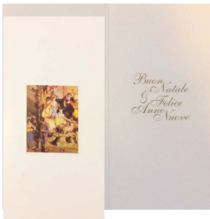
Biglietto “ Natività ” (con busta) cm 10,5x21 - € 2,00