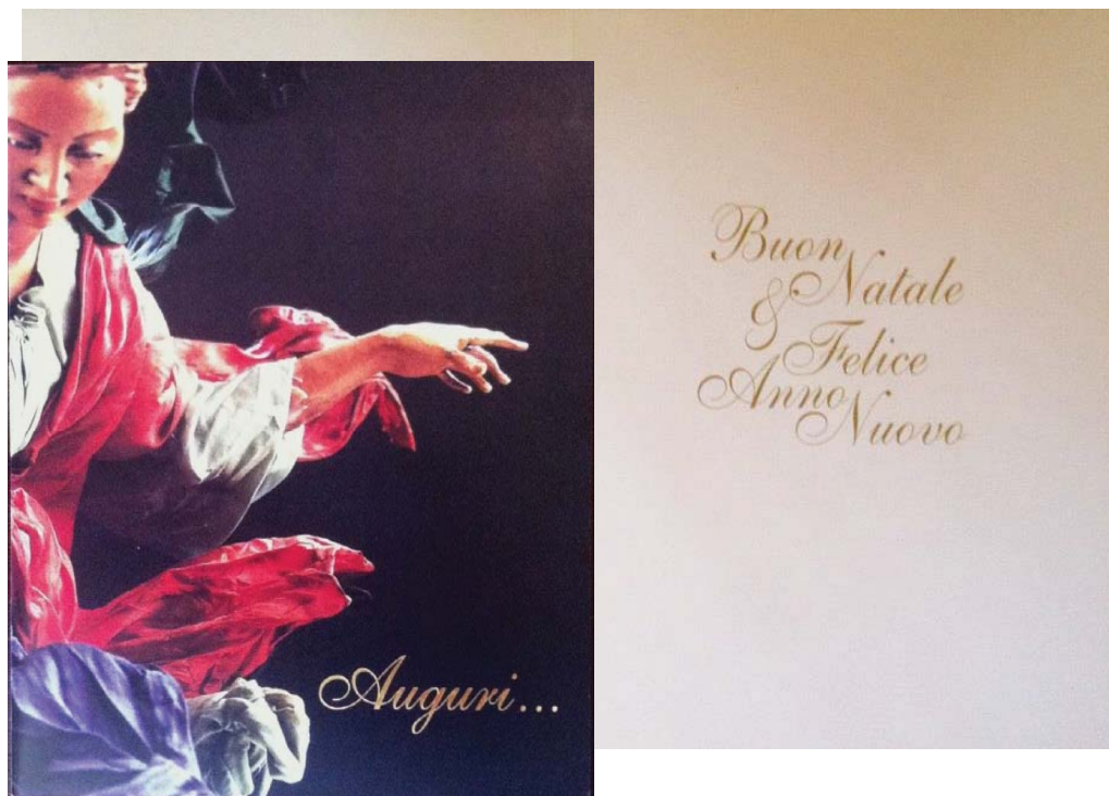
Biglietto “ Angelo ” (con busta) cm 15x21 - € 2,50